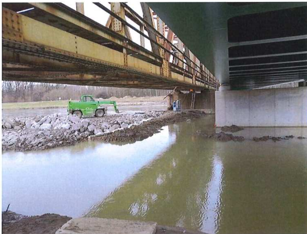
Príprava platformy na demontáž mosta cez rieku Morava – SO 12-33-04