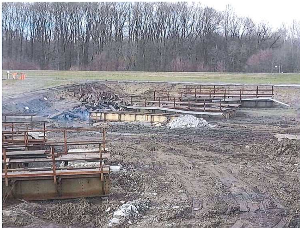
Rezanie OK z demontovaných predpolí mosta cez rieku Morava – SO 12-33-04