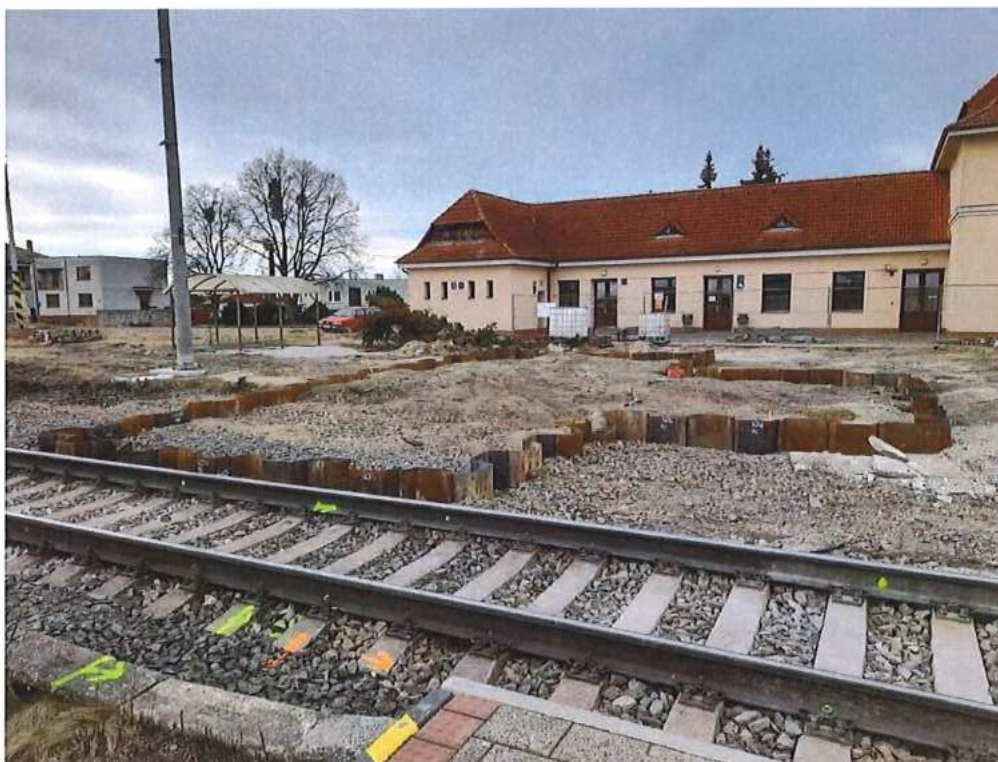
Ukončenie baranenia larsen – SO 11-33-01