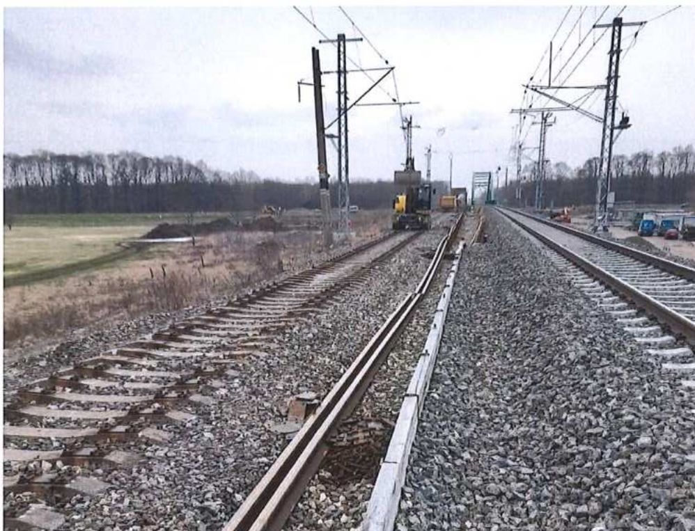
Demontáž žel. zvršku TK 1 v km 73,500 - 74,000 - SO 12-32-01