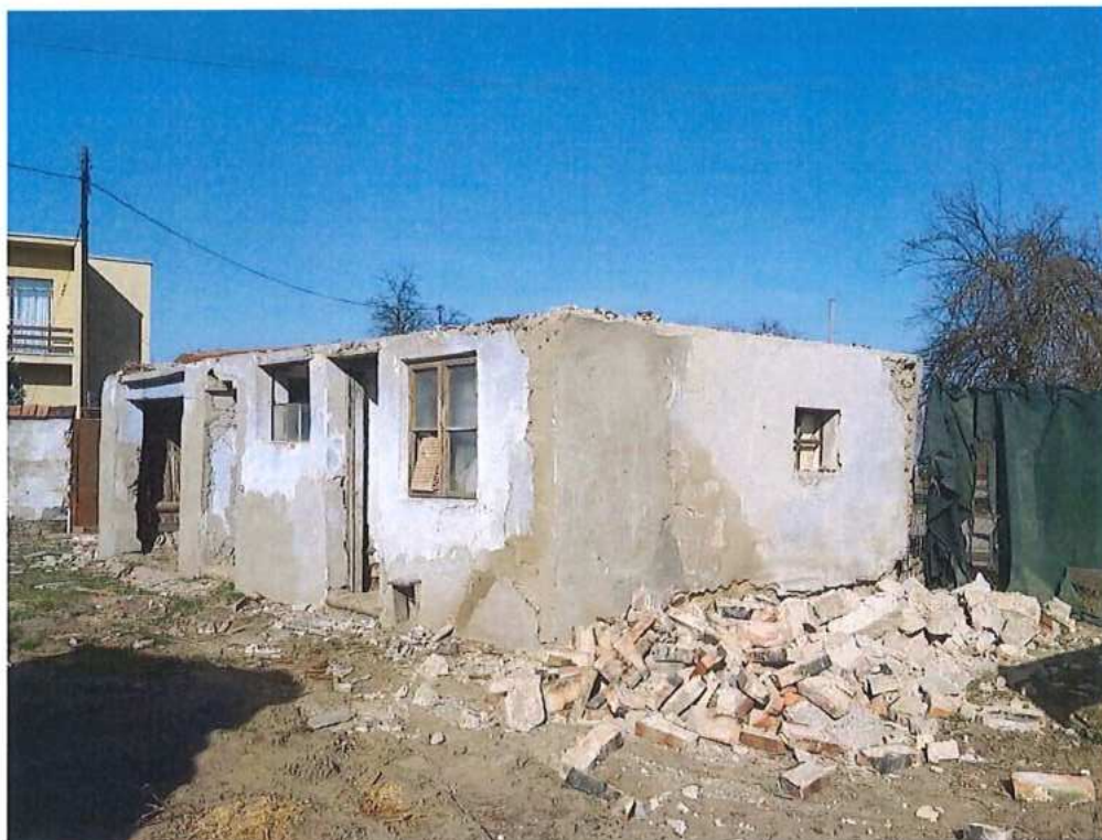
Búranie RD v Brodskom – SO 11-31-02