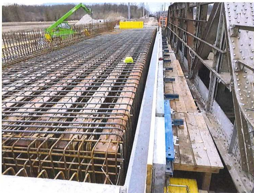
Armovanie N.K. – SO 12-33-01