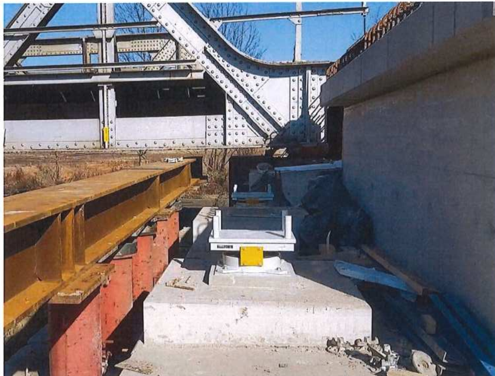
Osadenie ložísk – SO 12-33-02