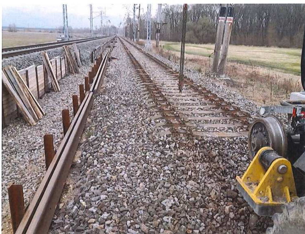
Demontáž žel. zvršku TK 1 v km 73,500 - 74,000 - SO 12-32-01