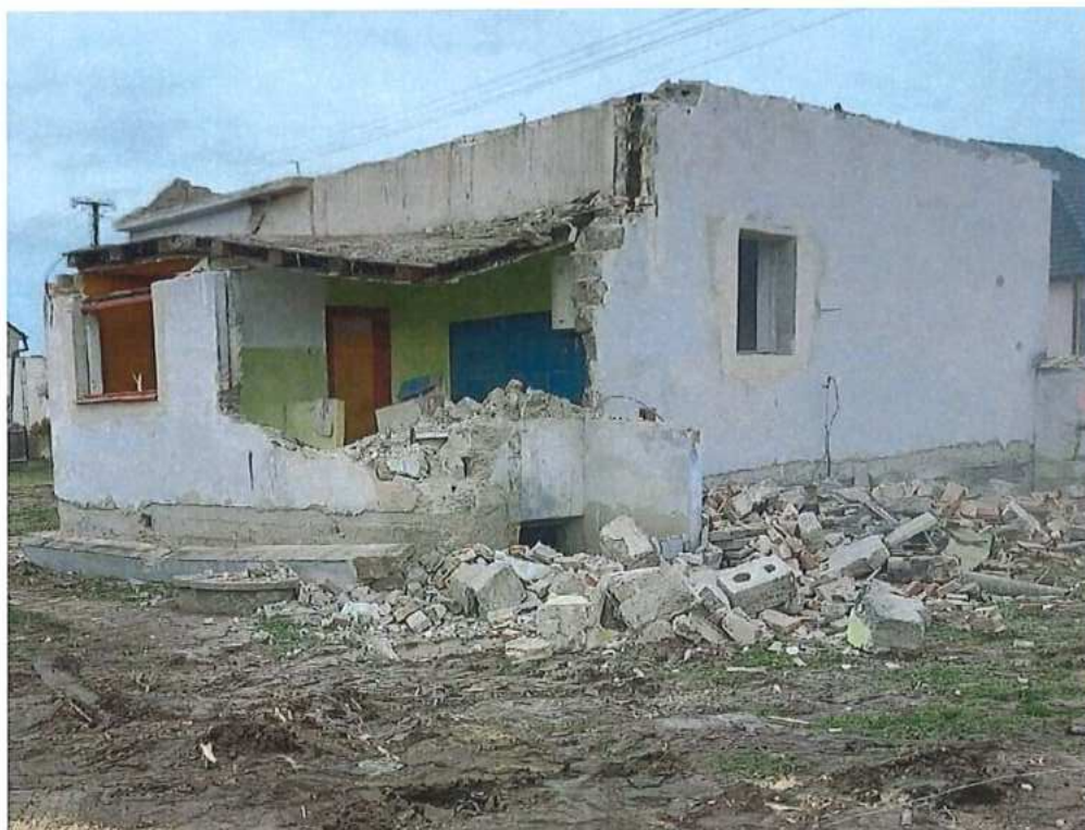
Búranie RD v Brodskom – SO 11-31-02