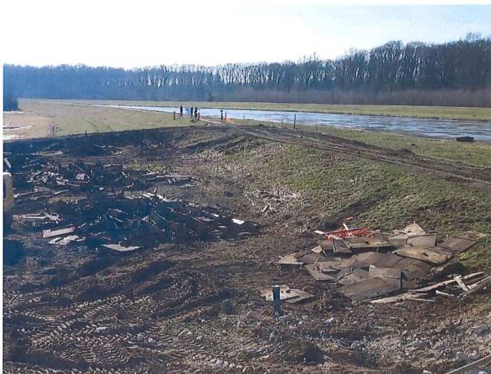
Rezanie OK z demontovaných predpolí mosta cez rieku Morava – SO 12-33-04