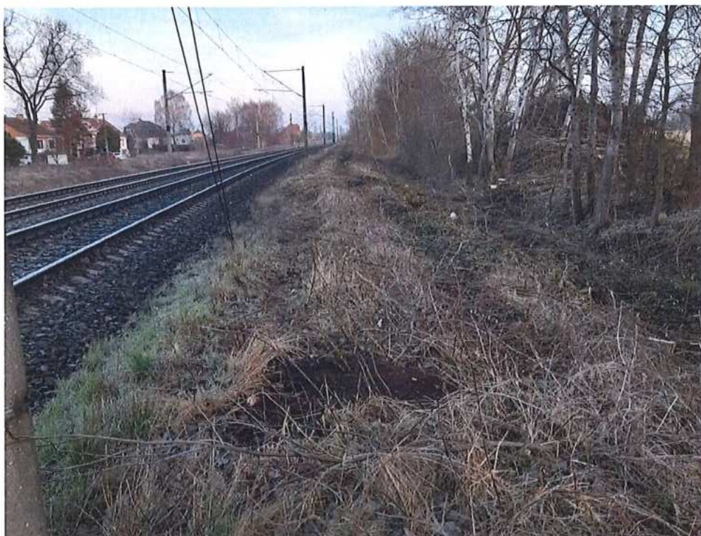
Výrub drevín – SO 10-31-01