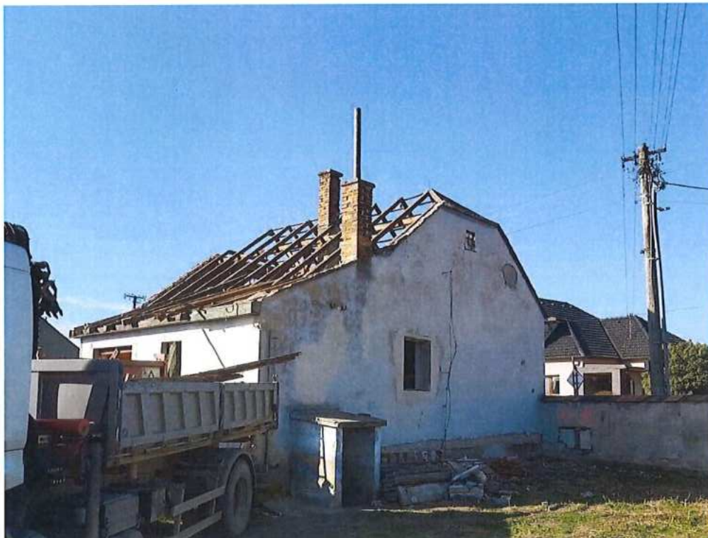
Búranie RD v Brodskom – SO 11-31-02