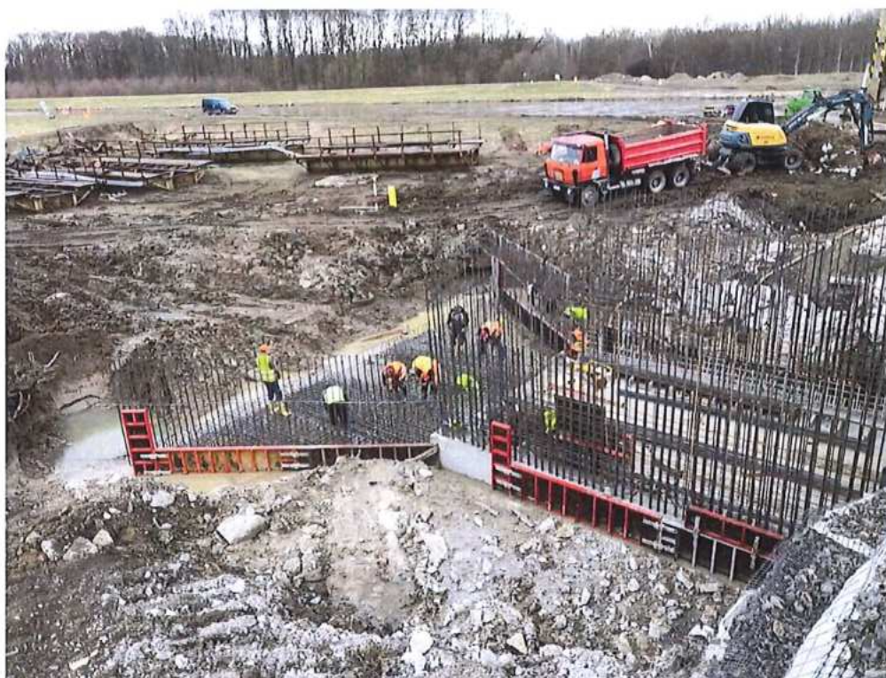
Debnenie a armovanie spodnej dosky – SO 12-33-03