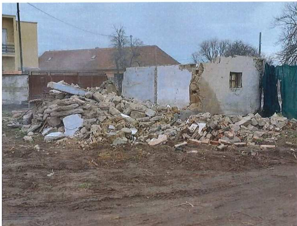
Búranie RD v Brodskom – SO 11-31-02