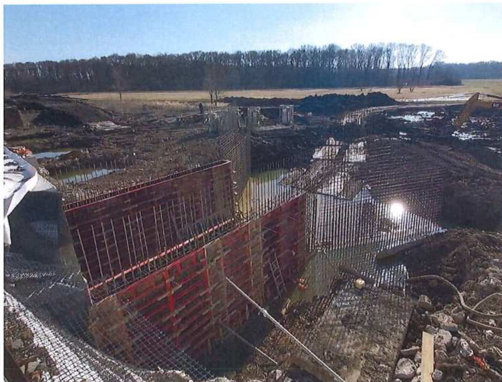
Debnenie stien a armovanie krídiel – SO 12-33-03