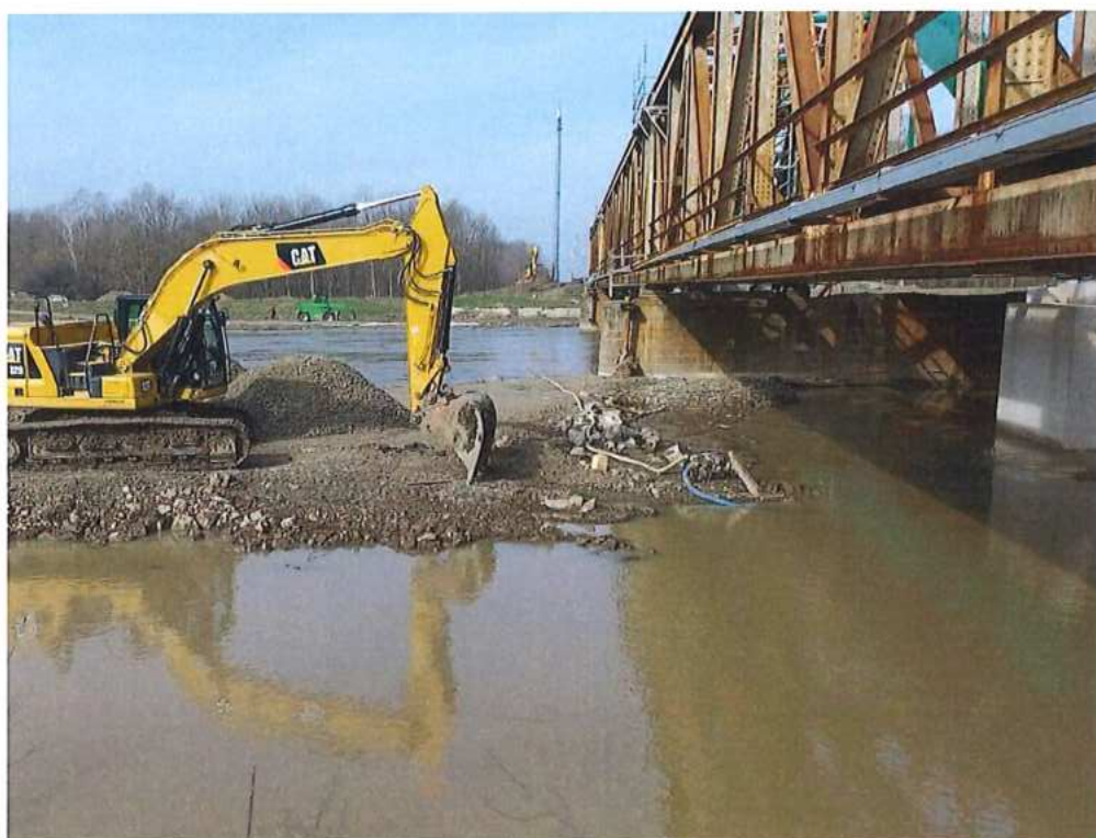
Príprava plošiny pre žeriav na demontáž mosta cez rieku Morava na SK strane – SO 12-33-04