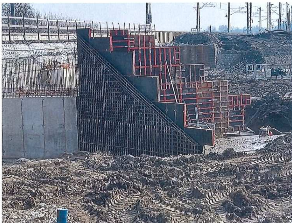
Armovanie a debnenie krídiel – SO 12-33-03