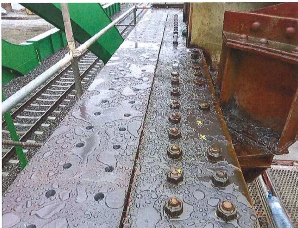
Príprava OK (hlavné mostné polia) na demontáž – SO 12-33-04