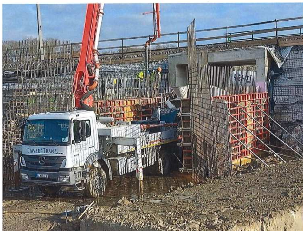
Betonáž stien – SO 12-33-03