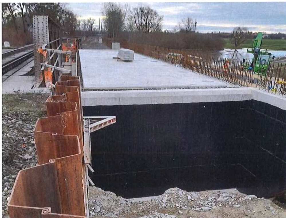
Izolácia stien opôr – SO 12-33-01