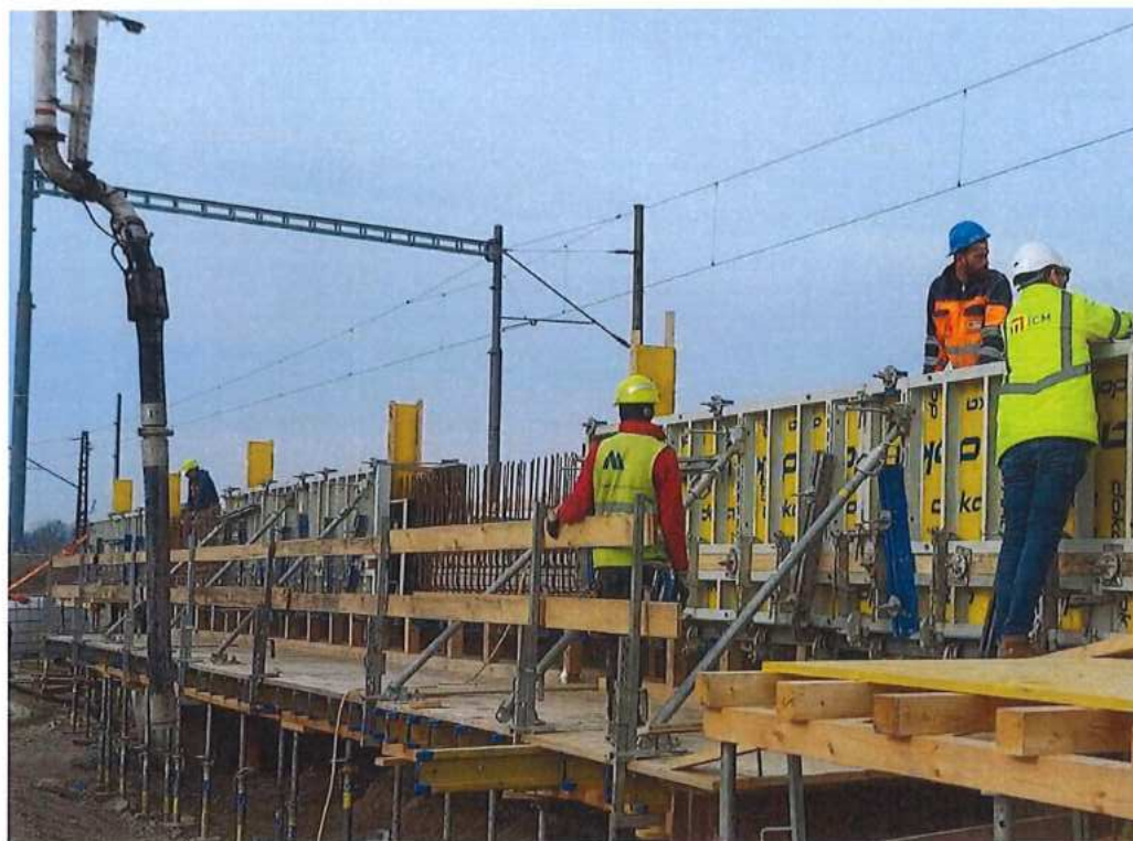
Betonáž ríms – SO 12-33-01