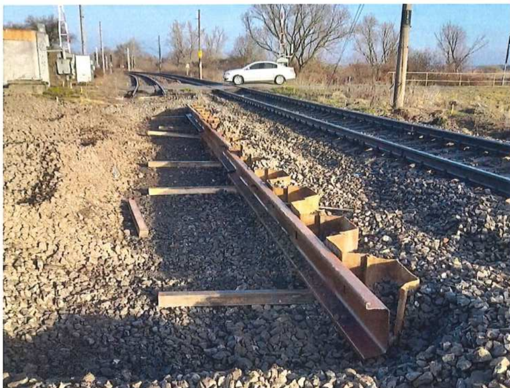
Kotvenie larsen – SO 11-33-04