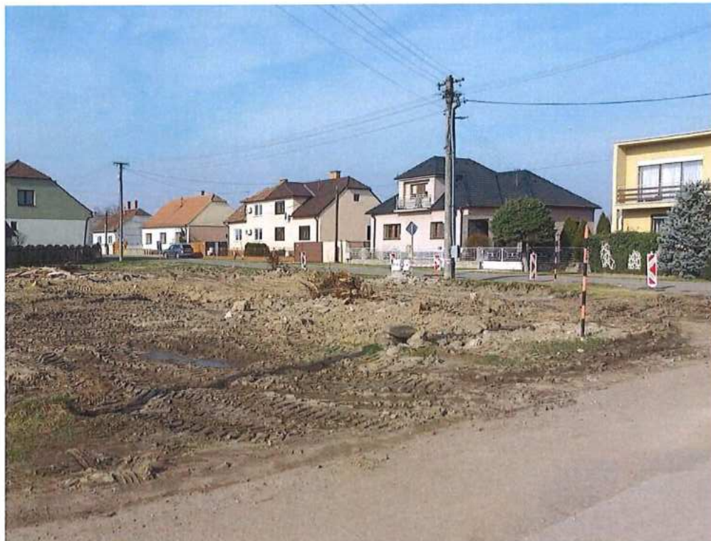
Zbúranie RD v Brodskom – SO 11-31-02