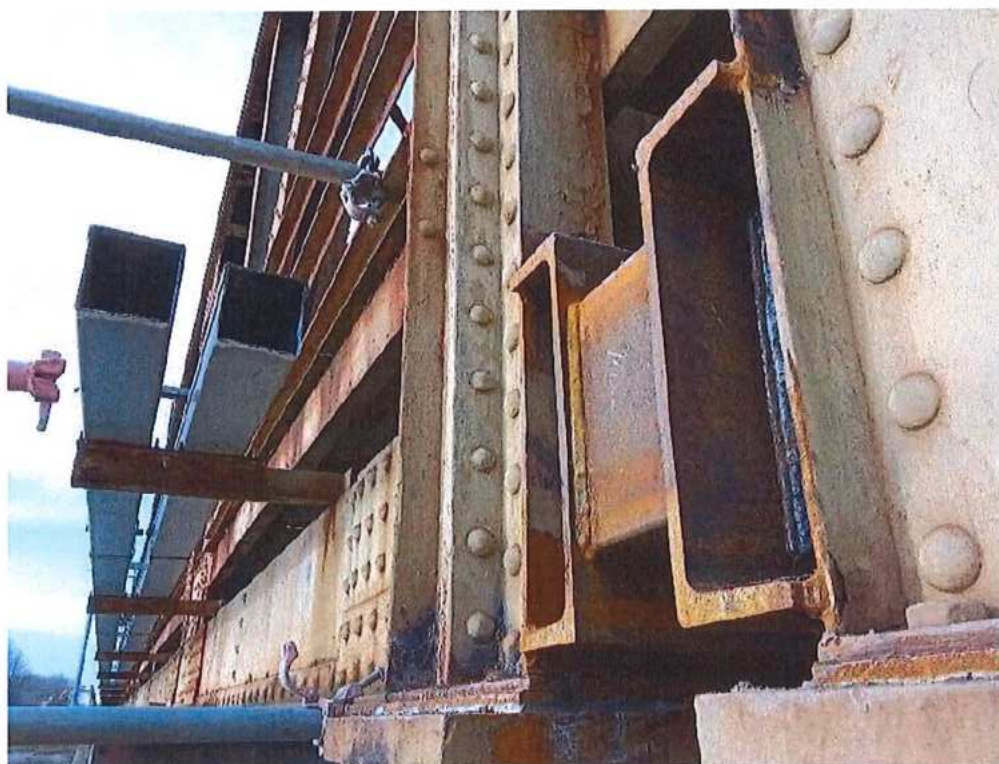
Príprava OK (hlavné mostné polia) na demontáž – SO 12-33-04