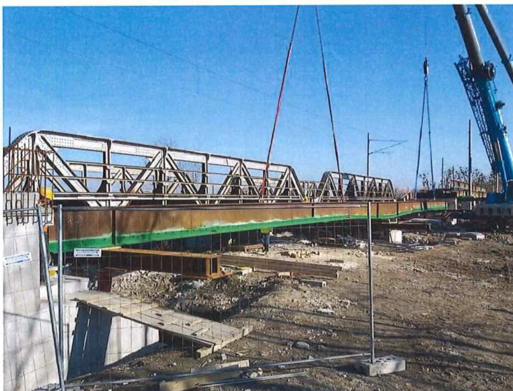
Montáž nosníkov – SO 12-33-02